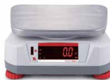
Display posteriore con sensore touchless integrato